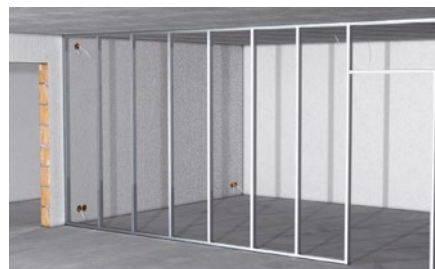
Draht- und Noniusabhängiger